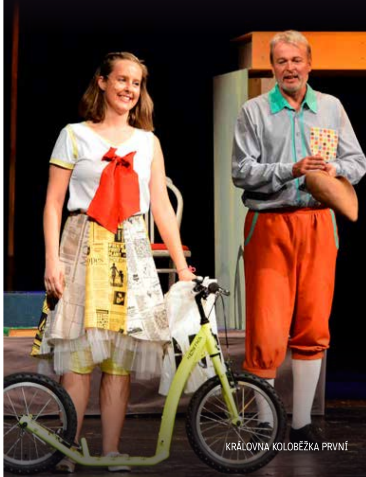
KRÁLOVNA KOLOBEŽKA PRVNÍ