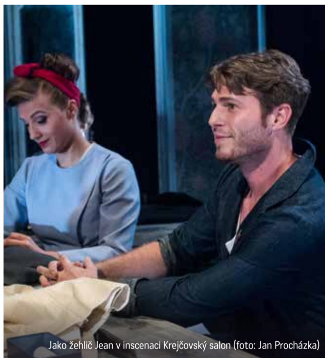
Jako zehlič Jean v inscenaci Krejčovský salon

Váš první výraznou rolí v Olomouci byl Michael z Rodinné slavnosti. Jak jste se sžíval s postavou, která díky svému machismu,