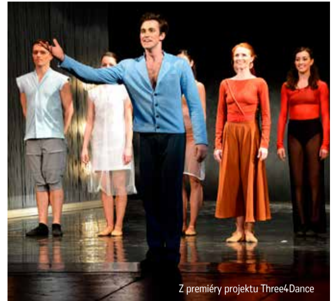
Z premiéry projektu Three4Dance

„Balet Moravského divadla Olomouc se premiérou komponovaného večera Three4Dance zařadil mezi soubory jako Národní divadlo moravskoslezské, Národní divadlo Brno či pražské Národní divadlo, které taneční večery složené z vícero kratších, zejména současných, choreografií pravidelně zařazují do svého repertoáru již několik sezon. (...) Three4Dance je významným krokem pro dosavadní dramaturgii souboru a můžeme doufat, že komponované večery i díla hostujících choreografů budou k vidění na jevišti Moravského divadla stále častěji.“