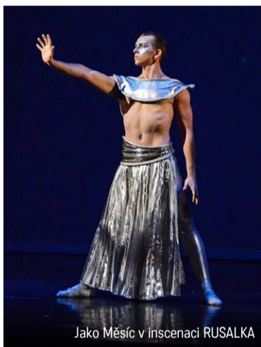
Jako Měsíc v inscenaci RUSALKA

Je to právě zmíněná role Armanda Duvala v nádherné Dámě s kaméliemi. Je to krásná, technicky velmi náročná role, zároveň však plná emocí. Musím ale říci, že jsem doposud měl štěstí na zajímavé role a každou mám skutečně rád. Třeba mě velmi baví a užívám si roli