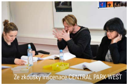
Ze zkoušky inscenace CENTRAL PARK WEST

Populární komediografové Roman Vencel a Michaela Doleželová pak na konci ledna uvedou pozapomenutou komedii Woodyho Allena Central Park West o jedné manželské krizi. „Pracovat na Allenově textu je splnění mého dalšího snu! Woody je pro mě nejlepším komediálním autorem dvacátého století, a proto jsme sáhli po jeho divadelní hře Central Park West . U nás je prakticky neznámá a Woody ji psal přímo pro divadlo, ve filmu se tahle zápleťka nikdy neobjevila,“ zdůraznil Vencel. Diváky čeká typická smrtš allenovských břitkých a skvěle vypointovaných dialogů. „Obecně je rozšířený názor, že se ve filmech Woodyho Allena až příliš mluví. Ale není to pravda. Jen jsou jeho dialogy vměstnány vždy do devadesáti minut a ne roztaženy na dvě hodiny. Naši herci už vědí, že budou muset mluvit v tempu, které není na jevišti úplně obvyklé, a tak se začali učit texty už týden před samotným zkoušením,“ přiblížil Vencel. ■