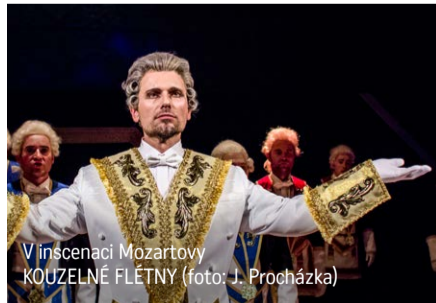
V inscenaci Mozartovy KOUZELNÉ FLÉTNY