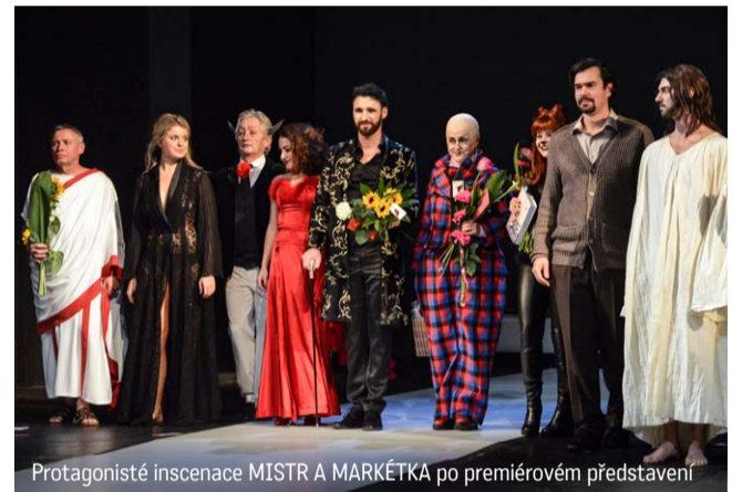
Protagonisté inscenace MISTR A MARKÉTKA po premiérovém představení