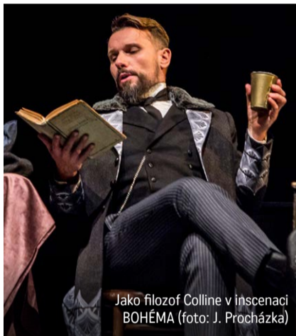
Jako filozof Colline v inscenaci BOHÉMA

Máte možnost srovnání. Jaké je slovenské publikum v porovnání s českým?